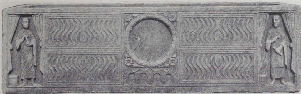
Fig. 189. — Sarcòfag dels portals amb cortines

bablement del segle III, i no pot ésser considerat l'obra d'un marbrista de la localitat, sinó com un vas funerari importat d'Itàlia completament acabat, per a servir de lloc de repòs d'algun ric tarragoní. Ens ho demostra també la qualitat del material, que no és cap pedra del país.