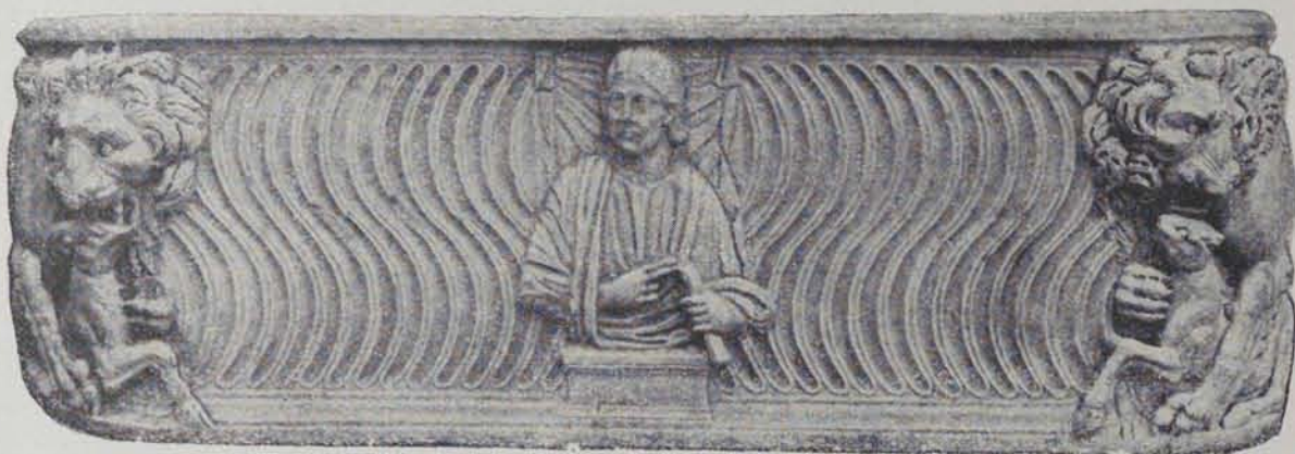
Fig. 187. — Sarcòfag dels lleons de la necròpolis de Tarragona

SARCÒFAGS STRIGIL·LATS. — Un primer grup el formen els sarcòfags strigil·lats. És sabut com des del segle III el tema de les estrigil·les és profusament usat en els sarcòfags. L'excavació de la necròpolis de Tarragona ens ha proporcionat nous exemplars i nous tipus desconeguts abans en l'arqueologia catalana. Un d'ells (fig. 187) és ornat en ses testes amb figures de lleons que abaten i devoren uns cérvols (1). La composició central és una figura de mig cos habillada amb