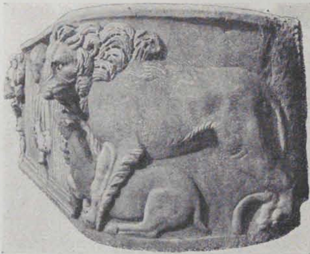
Fig. 188. — Vista lateral de la fig. 187

túnica i toga, posada sobre un pedestal, representant un personatge femení d'una certa edat, que amb la mà esquerra manté un volum i té la mà dreta creuada sobre el pit, posició ben freqüent en l'estatuària romana. Una draperia serveix de fons a la figura. A dreta i esquerra es desenrotlla la decoració en strigil·les fins a arribar als dos extrems, en els quals hi ha els dos lleons que devoren les seves respectives preses (fig. 188). Els cossos dels lleons donen la volta al vas funerari, els extrems del qual ocupen. La crinera de les dues feres és abundosa i vigorosament treballada a cisell com la cara i les potes i ungles, la qual cosa dóna un tipus de lleó a la vegada naturalista i convencional. Els dos cérvols, com atuits sota el pes de les feres, no són tan expressius. La part posterior del sarcòfag és sens treballar, ço que ens demostra que anava arrambat a una paret. El sepulcre no porta inscripció de cap classe. Aquesta, cas d'haver-n'hi, degué ésser a la tapa, que ja no existia en el moment de la troballa. Aquest sarcòfag no és més que un nou cas d'una sèrie estereotipada que compta ja amb nombrosos exemplars que ofereixen entre ells diferències de detall, però que tots es redueixen a la mateixa composició. Aquest tipus de sarcòfag sembla correspondre als segles III, IV i V, havent-n'hi, sens variar en res la disposició, de manifestament pagans i de clarament cristians (2). El sarcòfag tarragoní dels lleons és pro-