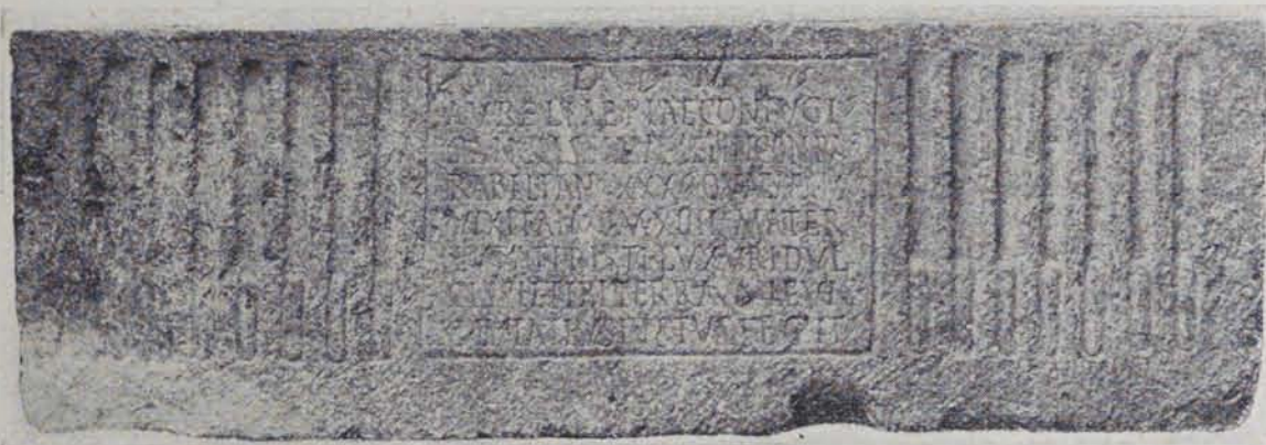
Fig. 191. — Sarcòfag d'Aurèlia

És fet de calissa blanca, amb vetes roges, que no resulta ésser cap pedra del país. Amida 2'10 metres de llarg per 0'60 d'alt i 0'60 d'ample; és rectangular externament i també així en la seva