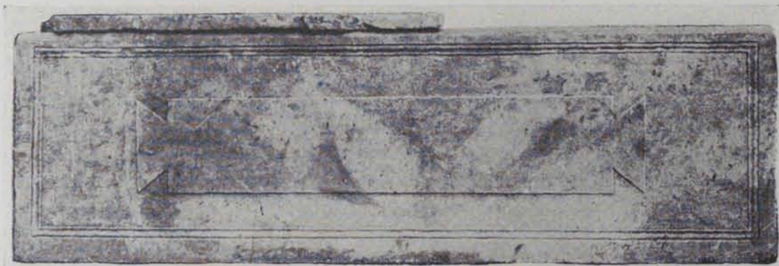
Fig. 193. — Sarcòfag de la tarja anepígrafa

tre rosetes, i encara unes campànules acaben d'omplir els buits. Aquesta corona està posada a la part d'amunt, deixant a sota un espai ornat de petites arcuacions sobre mènsules. L'espai central de la corona, el més apropiat per a haver-hi una inscripció, resta buit. El judiquem un producte d'importació cronològicament contemporani o tal volta més recent que el dels lleons citat.