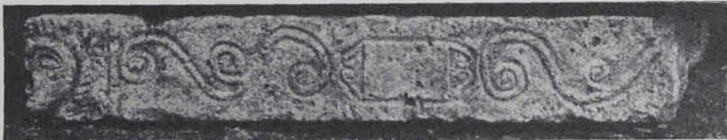
Fig. 195. — Tapa de sarcòfag capsat de màscares tràgiques

SARCÒFAGS MOTLLURATS. —Sovint eren sols les motlures les que ornaven el sarcòfag i la inscripció es gravava en una tarja al centre, com l'anepígraf trobat a la necròpolis de Tarragona (fig. 193) (número 5 de la publicació Serra Ràfols) (3).