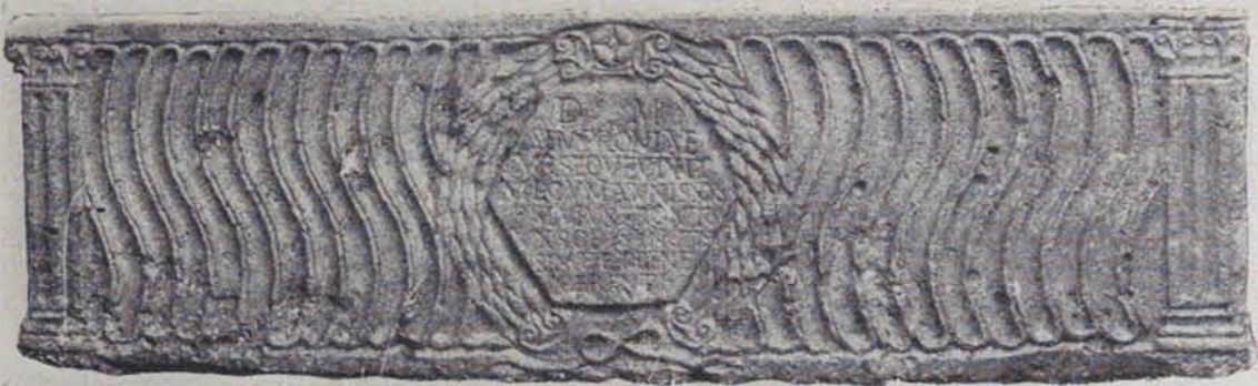
Fig. 190. — Sarcòfag de Semprònia Ursa

bablement del segle III, i no pot ésser considerat l'obra d'un marbrista de la localitat, sinó com un vas funerari importat d'Itàlia completament acabat, per a servir de lloc de repòs d'algun ric tarragoní. Ens ho demostra també la qualitat del material, que no és cap pedra del país.